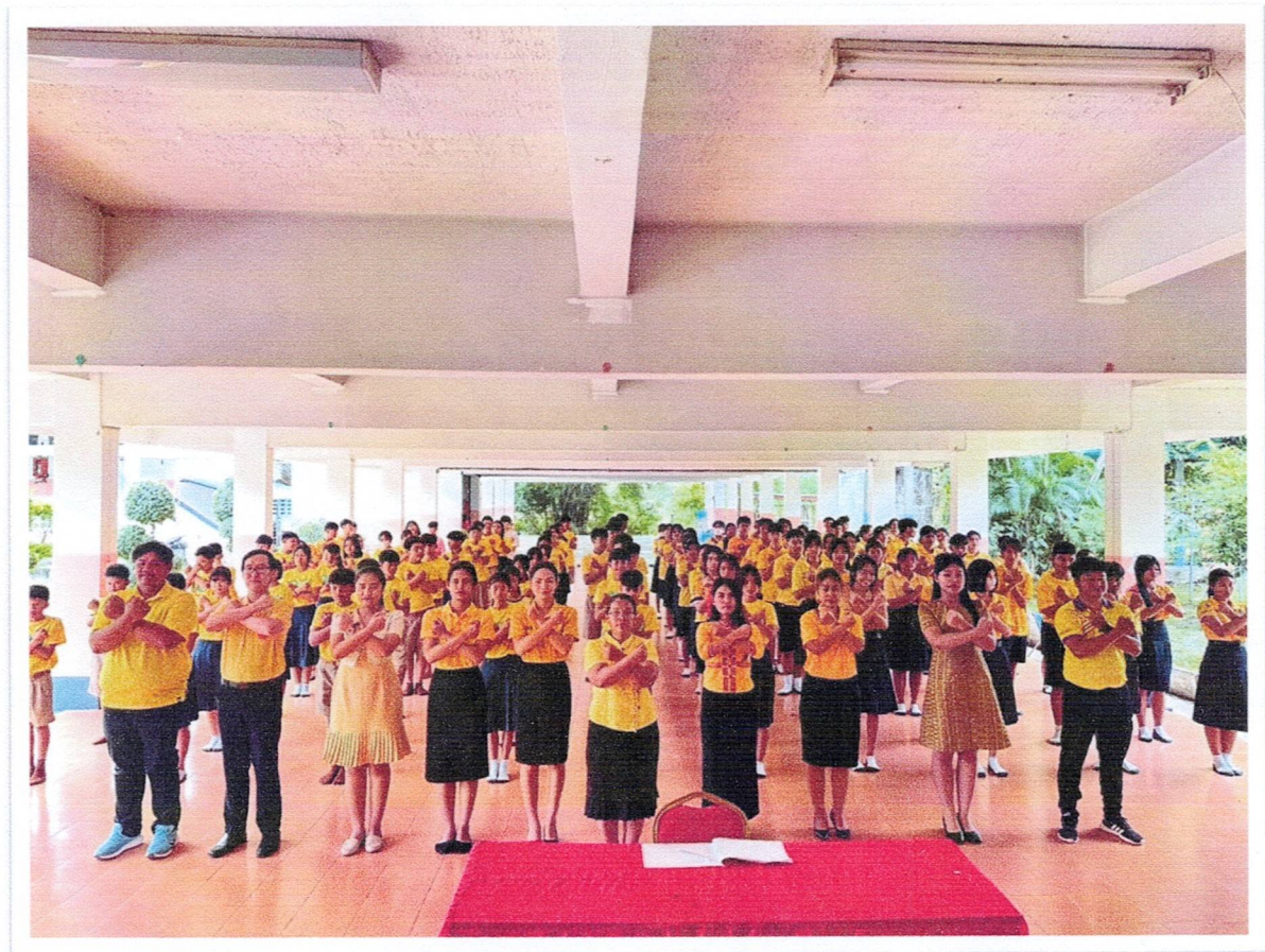
กิจกรรมสวดแทรกสาระด้านจริยธรรมแก่ ครู นักเรียนและบุคลากรทางการศึกษาในโรงเรียน