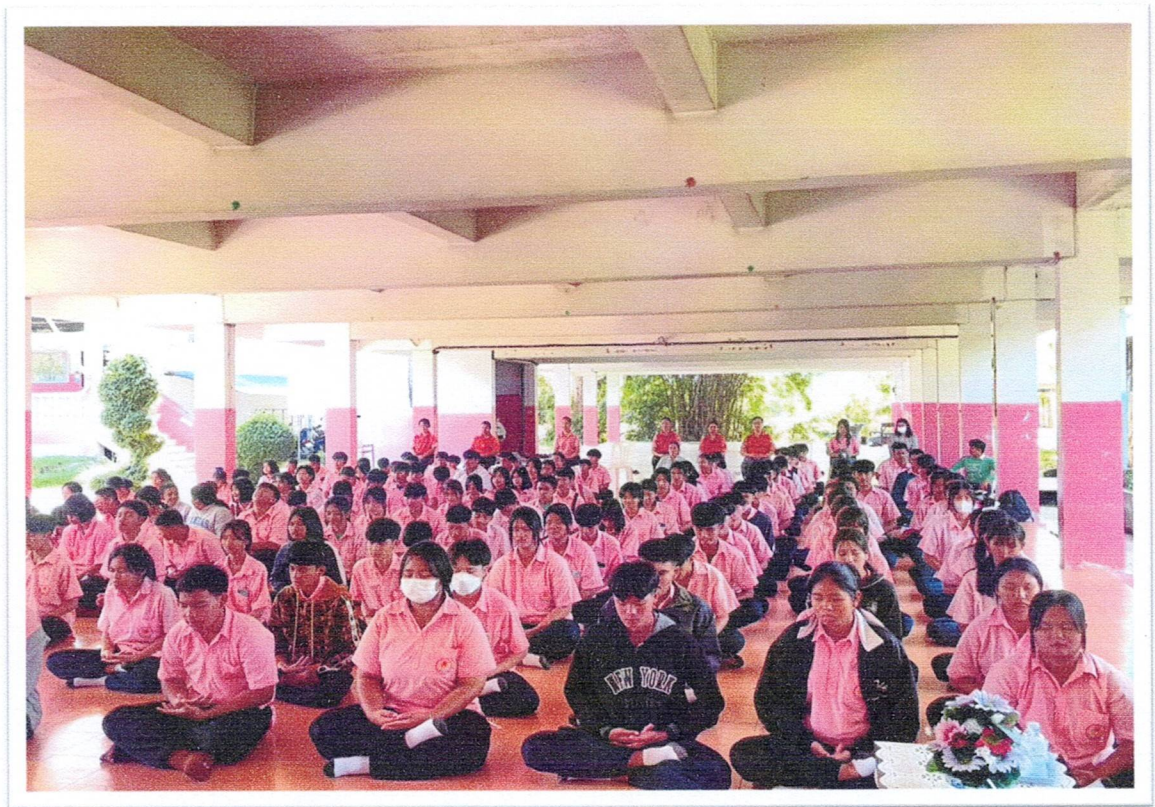
กิจกรรมสอดแทรกสาระด้านจริยธรรมแก่ ครู นักเรียนและบุคลากรทางการศึกษาในโรงเรียน